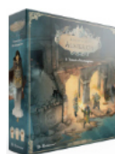
Aventures en Austerion (2 titres)